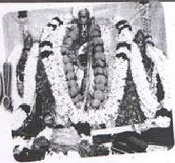
■ காரமடை அரங்கநாதர்.