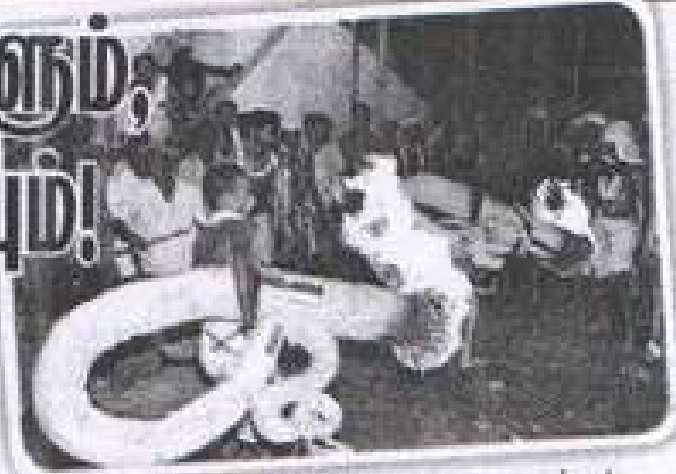
■ பந்த சேவையுடன் அரங்க தாசர்கள்.

பரிவேட்டை நாளாகிய அன்று, காணும் இடம் எல்லாம், கூட்டம் கூட்டமாக கைகளில் பந்தங்களை ஏந்திக் கொண்டு, தாசர்கள், 'கோவிந்தா பராக்! ரங்கா பராக்! கோவிந்தா, கோவிந்தா'