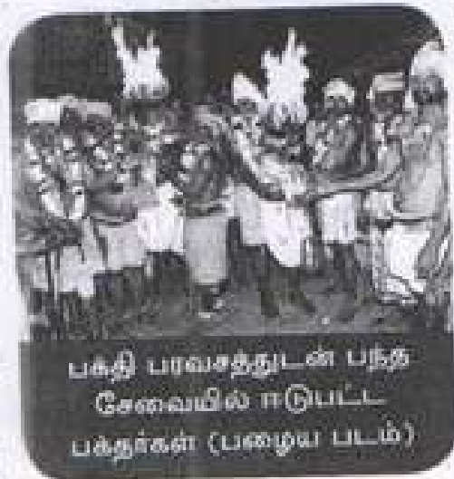
பக்தி பாவசத்தூடன் பந்த சேவையில் ஈடுபட்ட பக்தர்கள் (பழைய படம்)

குருமிடம் நல்லழி அழிந்து, தன் உடலில் பன்னிரண்டு இடங்களில் திருமண்காப்பு தரித்து, துளசி மணி மாலை அணிந்து, கால், இடுப்பில் சதங்கைகளை கட்டிக்கொண்டு, கையில் சங்கு, சேகண்டி, பிரம்பு, சுத்தி, தோல்பை, காதுணிகலன், மஞ்சளாடை போன்ற புதினெட்டு வகை சின்னங்களை தரித்து, அருளுடனும் ஆவேசத்துடனும் ஆலயம் சென்று அரங்களை கண்டு அகமலர்ந்து, தன்னை உணர்ந்து பிறர்க்கும் உணர்த்துவதே,