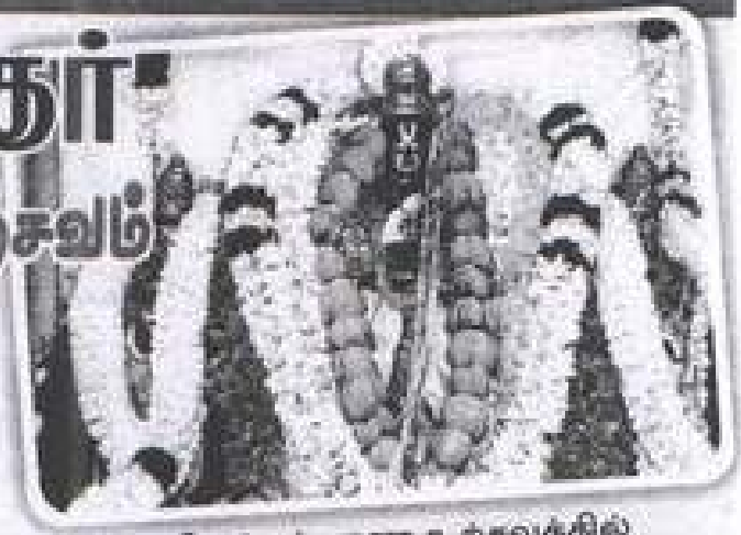
■ திருக்கல்யாண உற்சவத்தில் காரமடை அரங்கநாதர்.